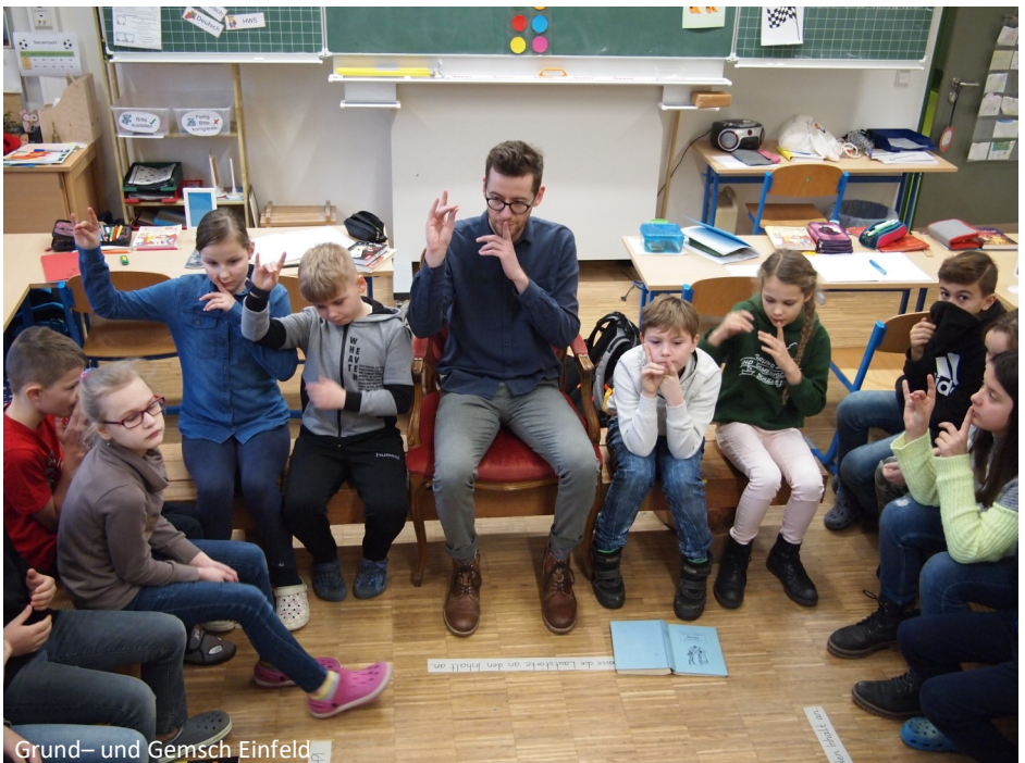
Grund- und Gemisch Einfeld

Im Laufe der Therapie sollen Selbstbewusstsein und Körpergefühl gefördert werden, um zur selbstständigen Handlungsweise zu führen.