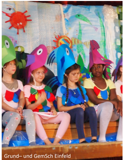
Grund- und GemSch Einfeld

Danach liegt es in der Hand der Eltern, einen geruhsamen, einen ereignisreichen oder feierlichen Tag für die Schulanfängerin/ den Schulanfänger und die Familie zu gestalten. Ob die Familie zusammen essen geht, in einen Freizeitpark fährt oder einen Ausflug in die Umgebung macht, hängt auch vom Kind ab. Was dabei sicher nicht fehlen darf, sind Erinnerungsfotos dieses unwiederbringlichen ersten Schultages.