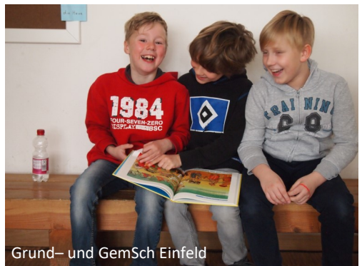
Grund- und GemSch Einfeld

Schaffen Sie einen Ort, an dem Ihr Kind ungestört ist und fördern Sie die spielerische Annäherung Ihres Kindes an den Schulstart!